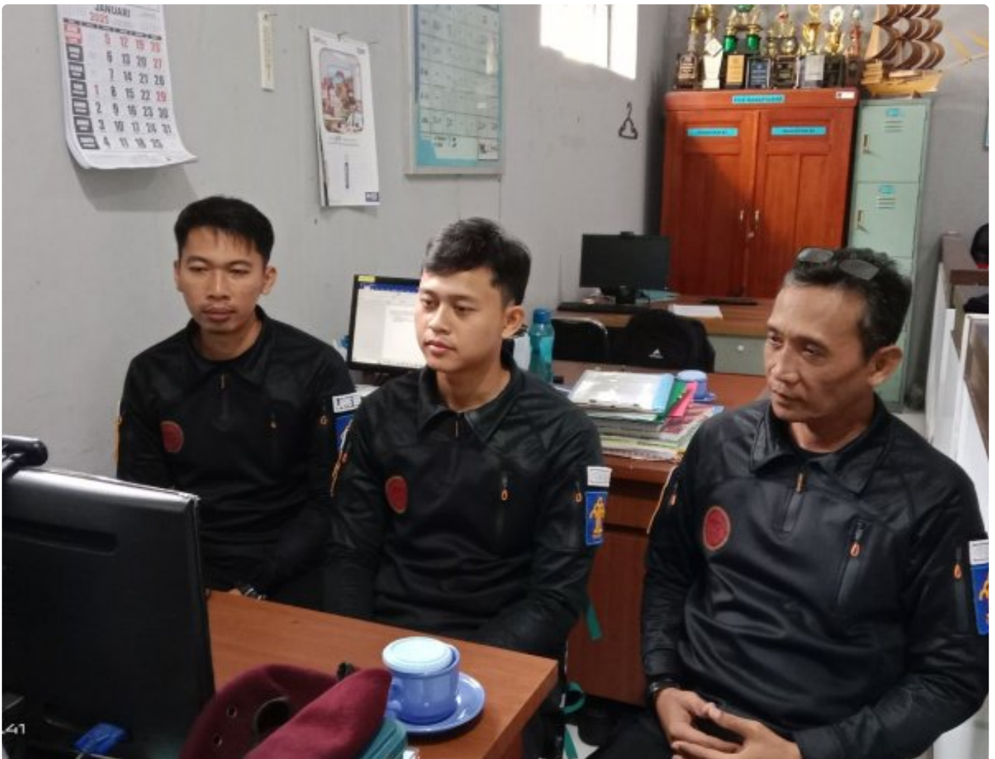
Bangun Harmoni dan Strategi, Lapas Besi Ikuti Webinar Refleksi Akhir Tahun 2024 & Resolusi 2025

CILACAP – Sebagai salah satu langkah dalam pengembangan kompetensi bagi Aparatur Sipil Negara (ASN), Petugas Lembaga Pemasyarakatan Kelas IIA Besi berpartisipasi dalam kegiatan webinar bertajuk "Refleksi Akhir Tahun 2024 dan